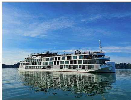
五星級遊輪-印度支那號