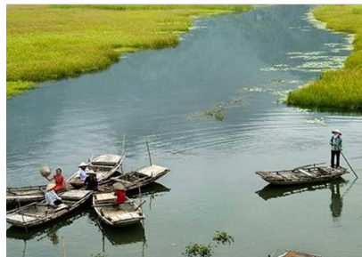
長安湖生態保護區

【三谷古剎~碧洞寺】碧洞(Chua Bich Dong)，意為『藍天綠地之洞』，位於寧平市郊離市區約 11 公里，建於 10 世紀丁、黎朝時期，是三谷(Tam C?c)地區著名的古剎，有南天第二洞之稱。碧洞寺主要包含三間廟宇，分為上、中、下三層，分別稱為 Ha Pagodas (下廟)、Trung Pagodas (中廟)及 Thuong Pagodas (上廟)，古廟為木建築，古色古香，精巧雅致。站在古廟的第三層上，可遠眺田野與山峰連成一氣的鐘靈毓秀，讓人頗有心曠神怡之感。