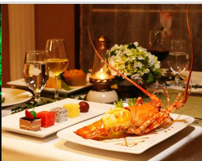
浪漫燭光晚餐~每人龍蝦一隻

住宿：★★★★★五星奢華豪華遊輪：印度支那號 Indochine Cruise (露臺海景房)或同等級旅館