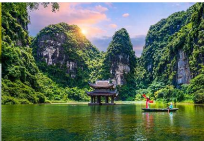
長安湖生態保護區