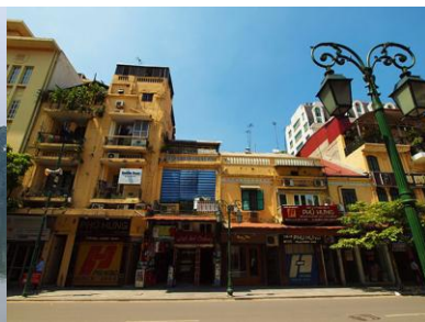
三十六條古街漫遊